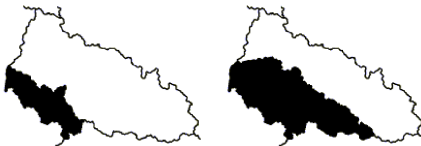
Situace z 15. a 18. března 1939

Na XVIII. sjezdu komunistické strany, který se konal v Moskvě od 10. do 21. března 1939, se Stalin jen s posměchem zmínil o plánech Velké Ukrajiny, nic víc. Konstatoval - už v duchu orientace, která záhy vyvrcholí smlouvou s Německem -, že SSSR se "nedá zatáhnout do konfliktů s válečnými provokatéry".