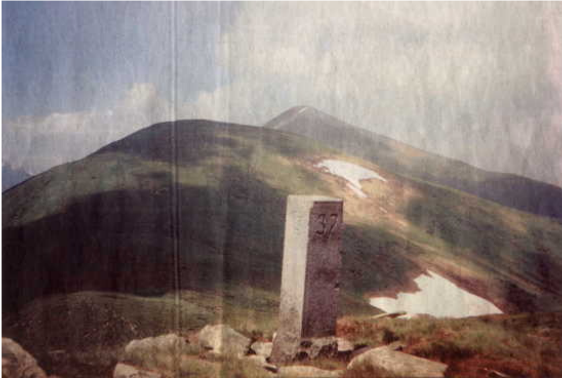
Podkarpatská Rus dnes: Na mnoha místech ještě nalezneme památku na období mezi válkami. Československo- polský hraniční kámen na hřebeni Čorné hory. Dnes je z obou stran Ukrajina.