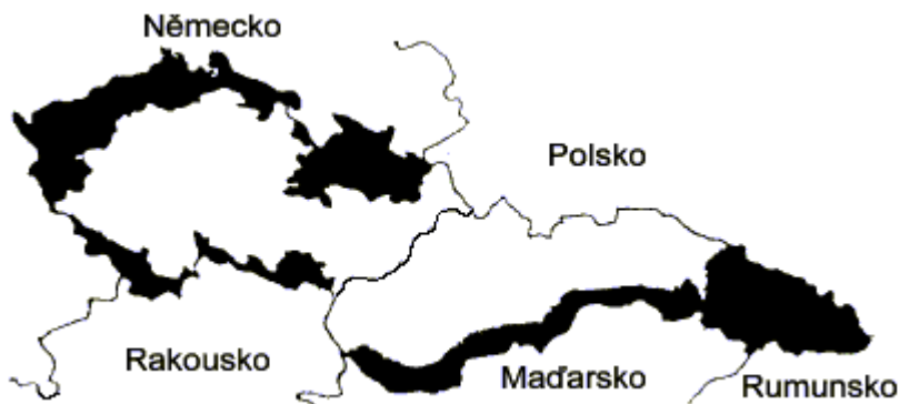
Mapa Československa roku 1939: černě vyznačené území okupovaly Německo a Maďarsko

Evropa mlčí. Ještě nestrávila mnichovskou zradu a již je tu její tragický následek. Poslední výstřely pod Karpaty, mrtví i ranění, ústupy 45. pěšího pluku i vyhnání občanů provázejí tyto poslední tragické dny a hodiny Československa, které mizí z mapy Evropy. Od té doby se již nikdy Podkarpatské Rusi nedostane demokracie, svobody a nezávislosti.